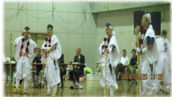
【青年の家職員による山伏問答】

1日目、英彦山青年の家体育館で、添田町主催の「英彦山山開き前夜祭」に参加しました。青年の家職員等が行った「山伏問答」、英彦山婦人会保存会が行った「英彦山踊り・英彦山ガラガラ節」を見学しました。また、フォークソングステージや参加者全員参加の〇×クイズが行われ、最後は、参加者全員で炭坑節を踊りました。