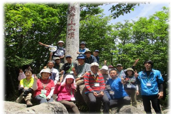
【中岳頂上での集合写真】