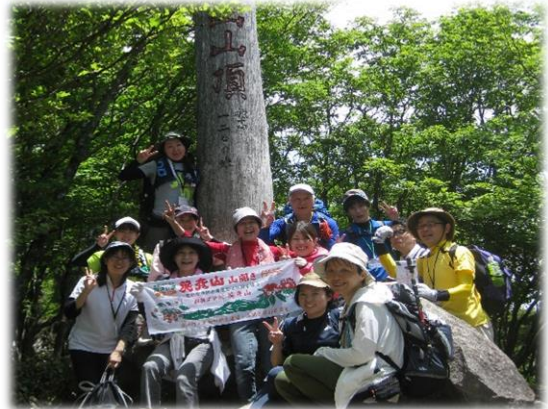
【中岳頂上での集合写真】