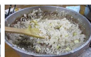
【ヒコマロンライス】