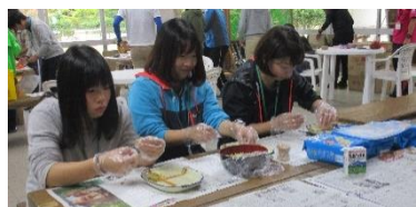
【ヒコマロンサンド】

研修の最後に、自分たちで調理した夕食を囲んで、英彦山カフェを開き、楽しい交流会を行いました。