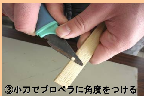
③小刀でプロペラに角度をつける