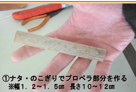
①ナタ・のこぎりでプロペラ部分を作る ※幅1.2～1.5cm 長さ10～12cm