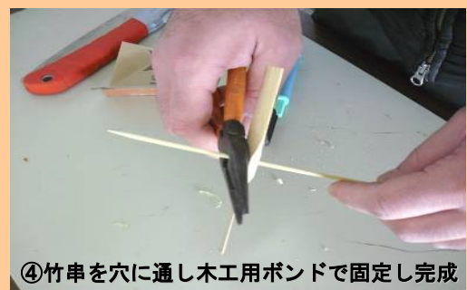
④竹串を穴に通し木工用ボンドで固定し完成