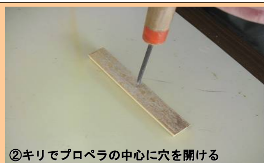
②キリでプロペラの中心に穴を開ける