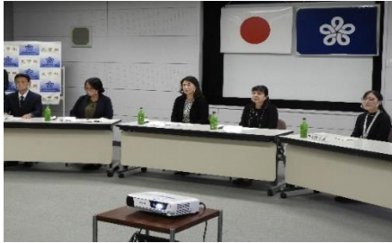
【実践発表2 座談会の様子】