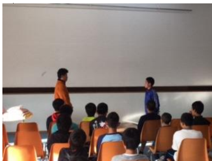
3泊4日よろしくお願ひします！

通学合宿の期間中、身の回りのことや学習等を自分たちで行いながら、生活しました。高学年は、進んで行動し、低学年の手本となったり、食事の準備やベッドメイキングなど、1人でするのが難しい作業では、優しく手伝ったりするなど、みんなで協力している姿がたくさん見られました。3泊4日を通して、皆とても逞しく成長することができました。