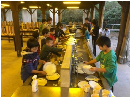
後片付けも自分たちでします！