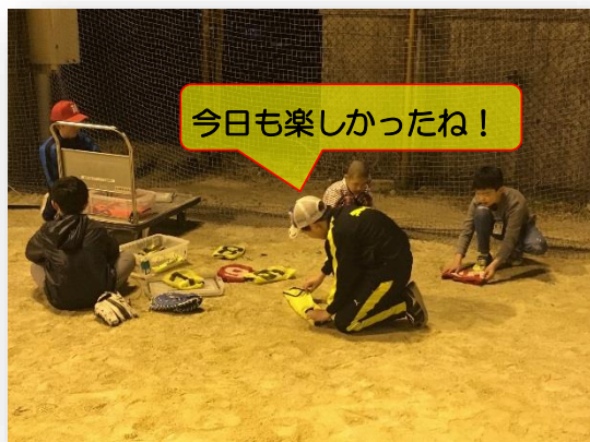
【みんなで協力して後片付け】