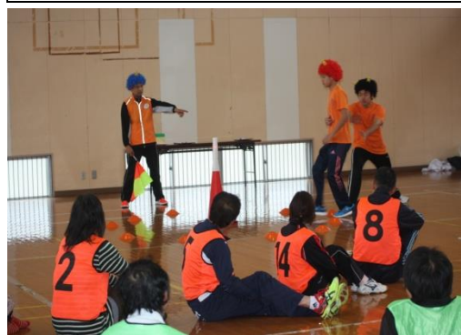
スポーツ鬼ごっこを指導する様子

青年リーダーの中心となる地域企画運営委員が集まって話し合い、研修計画や依頼の確認をするなど、楽しく活動をしています。 (2ヶ月に1回程度、夜に開催)