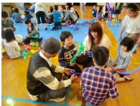
バルーンアートを教えている様子

レクリエーションの仕方や子どもたちが楽しく遊ぶ方法を学んだり、スポーツや読書といった子どもたちにとって大切なことについて話し合ったりして、楽しく活動しています。 (年3回程度実施)