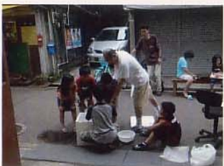
いろいろ教えてもらえるかも