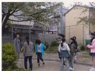
公園でも遊んでるよ