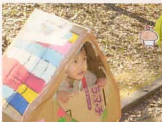
九大で基地づくり