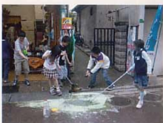
みずたまりで遊べ!