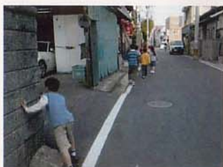
まち探検スタート!