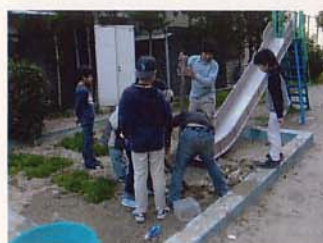
砂場のまちづくり