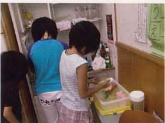
お手伝いクラブの誕生!