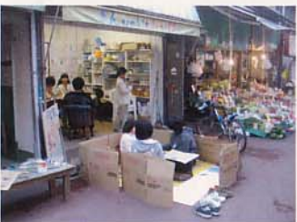
きんきゃんが広がった?!