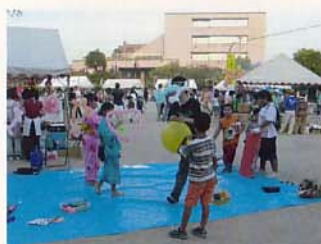
夏祭りにも参加したよ