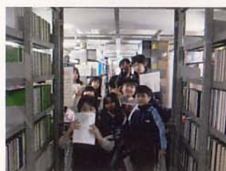
巨大な図書館を探検中!