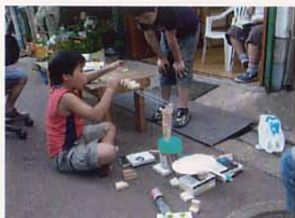
ピタゴラスイッチ!