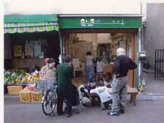
大人たちも立ち寄るよ