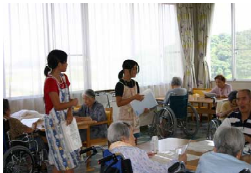
【ナーシングケア宗像】