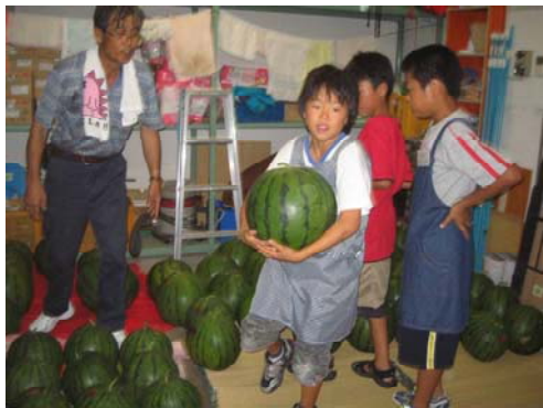
【ふれあい広場ふくま】