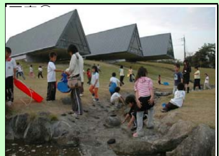
ふれあい塾で遊ぶ子どもたち