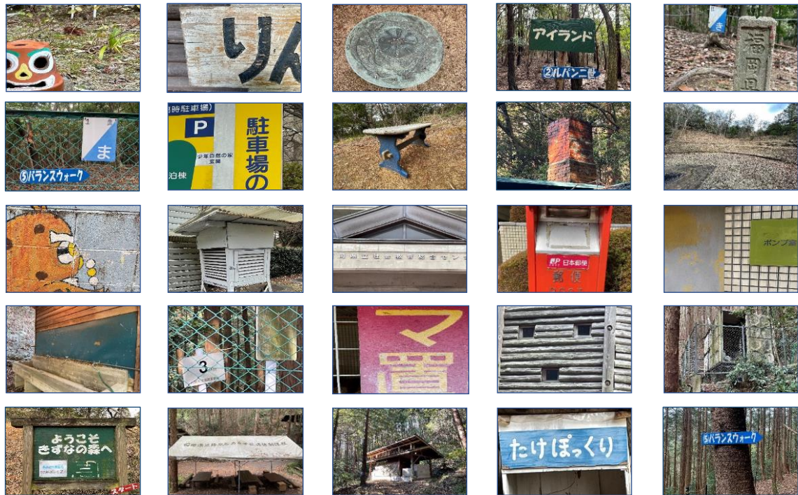
↑ フォトビンゴカード