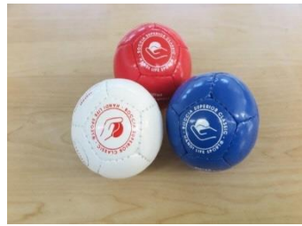
↑ ジャックボール(白)