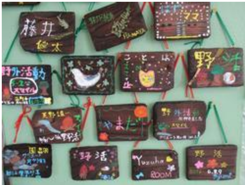
焼き杉工作 作品イメージ(例)