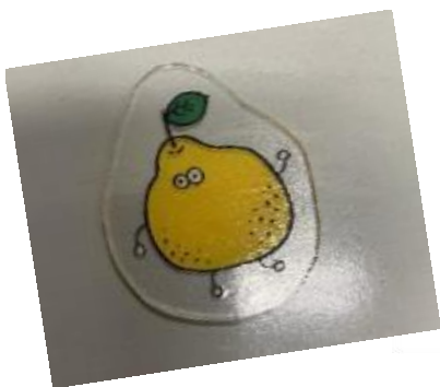
プラホビー作品イメージ

〈貸出物品〉 オーブントースター：5台 こて：4つ はさみ：33本 一つ穴パンチ：8個 カッターマット：153枚 ラジオペンチ：17つ ※貸出数には限りがございます。